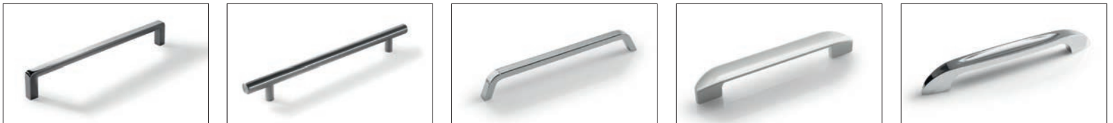
Chienti inox Steel Chienti Chienti inox Chienti acier Кьенти Нерж Chienti Edelstahl Cilindro inox Steel Cilindro Cilindro inox Cilindro acier Цилиндр Нерж Cilindro Edelstahl Georgia Cromo Chrome Georgia Georgia cromo Georgia chrome Джорджия Хром Georgia Chrom Frida bianco White Frida Frida blanco Frida blanc Фрида белая Frida Weiss Virginia Cromo Chrome Virginia Virginia cromo Virginia chrome Вирджиния хром Virginia Chrom

Handles Tiradores Poignées Ручки Griffe (int. 64mm e int. 160mm)