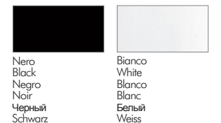
Nero Black Negro Noir Черный Schwarz Bianco White Blanco Blanc Белый Weiss