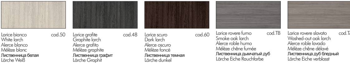
Larice bianco White larch Alerce blanco Mélèze blanc Лиственница белая Lärche Weiß cod.50 Larice grafite Graphite larch Alerce grafito Mélèze graphite Лиственница графит Lärche Graphit cod.48 Larice scuro Dark larch Alerce oscuro Mélèze foncé Лиственница темная Lärche dunkel cod.60 Larice rovere fumo Smoke oak larch Alerce roble humo Mélèze chêne fumée Лиственница дымчатый дуб Lärche Eiche Rauchfarbe cod.TB Larice rovere slavato Washed-out oak larch Alerce roble lavado Mélèze chêne délavé Лиственница дуб бледный Lärche Eiche verblasst cod.TA