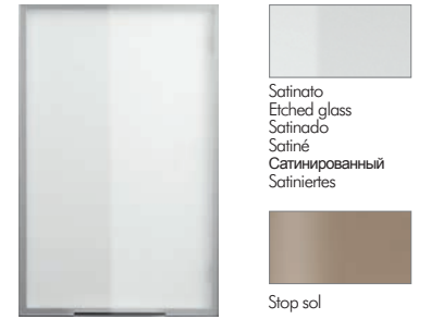
Satinato Etched glass Satinado Satiné Сатирированный Satiniertes Stop sol Jhon alluminio scotch bright Jhon aluminium scotch bright Jhon aluminium scotch bright Jhon алюминий scotch bright Jhon aluminium scotch bright Bordeaux Bordeaux Bordeaux Бордовый Bordeaux