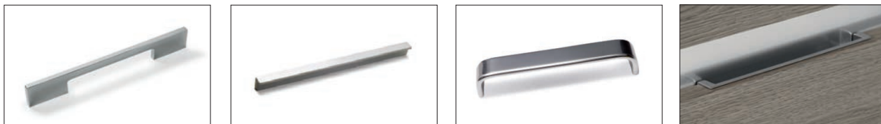
Venere Cromo Chrome Venere Venere cromo Venere chrome Венера хром Venere Chrom Elle - Scotch bright Ponte acciaio inox Stainless steel Ponte Ponte acero Ponte acier Ponte нержавеющей сталь Ponte Edelstahl Maniglia incassata per gola piatta Flush fit handle for plain c-channel Tirador empotrado para uñero plano Poignée encaissée pour gorge plate Врезная ручка для плоских выемок Eingebauten Griff für Griffmulde