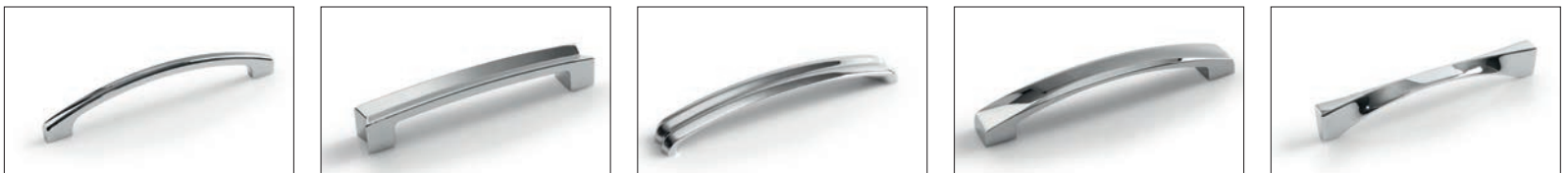
Tamara Cromo Chrome Tamara Tamara cromo Tamara chrome Тамара хром Tamara Chrom Marlene Cromo Chrome Marlene Marlene cromo Marlene chrome Марлен хром Marlene Chrom Emily Cromo Chrome Emily Emily cromo Emily chrome Эмилия хром Emily Chrom Kitty Cromo Chrome Kitty Kitty cromo Kitty chrome Кетти хром Kitty Chrom Nimah Cromo Chrome Nimah Nimah cromo Nimah chrome Нима хром Nimah Chrom