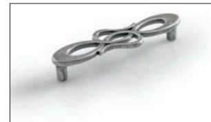
Saffo Argento Silver Plata Argent Серебро Silber