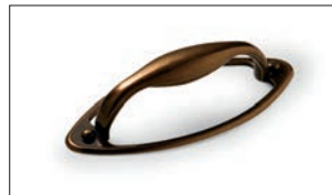
Cassetta Ottone antico Antique brass Latón antiguo Cuirre ancien Кассета Состаренная латунь Alter Messing