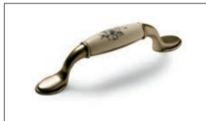
Trebbia con inserto in ceramica argento antico Antique silver Trebbia handle with ceramic insert Trebbia con decoración en cerámica plata antigua Trebbia en céramique argent ancien Треббиа с керамической вставкой Состаренное серебро Trebbia mit Keramikbeilage alter Silber