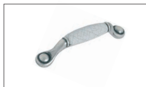
Flaminia Argento con inserto ceramico corda Silver with ceramic taupe Plata con inserción cerámica cuerda Argent avec insert en céramique corde Серебро с керамической вставкой пенька Silberfarbig mit Keramikeinlage Taupe