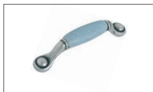
Flaminia Argento con inserto ceramico avio Silver with ceramic avio Plata con inserción cerámica avio Argent avec insert en céramique avio Серебро с керамической вставкой авио Silberfarbig mit Keramikeinlage Avio