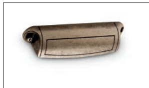
Stura Argento antico Antique silver Plata antigua Argent ancien Состаренное серебро Alter silber