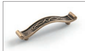
Jane Bronzo Bronze Bronze Bronza Bronze